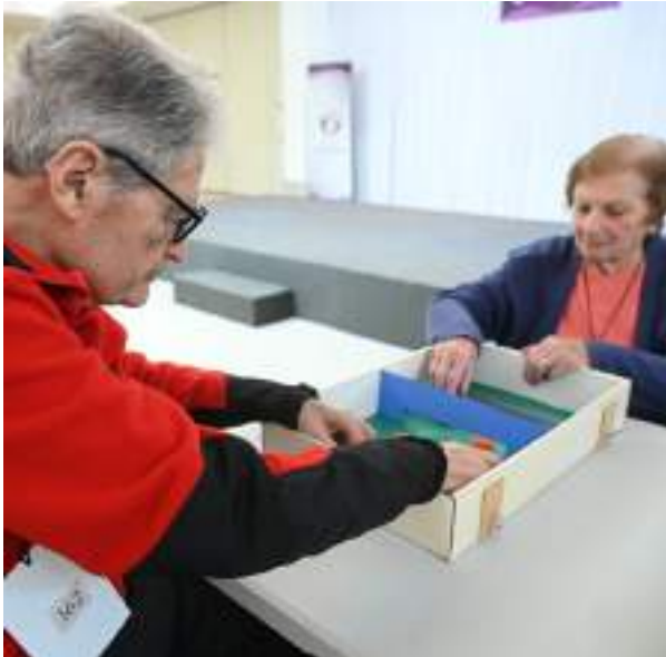
Kermesse realizada por Terapia Ocupacional.