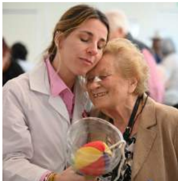
Kermesse realizada por Terapia Ocupacional.