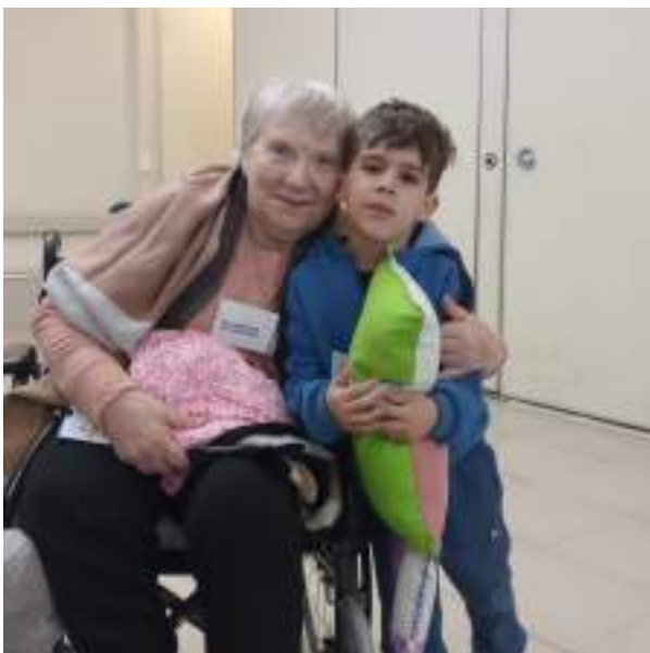
Entrega de muñecos proyecto lad el lad.