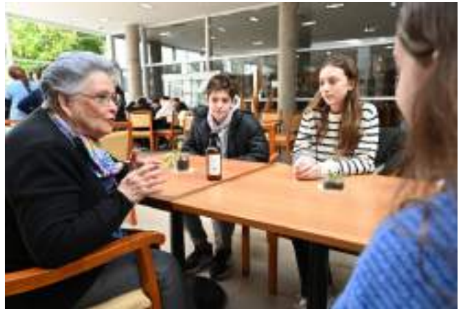
Encuentro Intergeneracional Iom Haatzmaut.

Los diálogos con relatos recíprocos, tuvieron presente la inquietud de los alumnos por los sucesos del 7 de octubre del 2023 en Israel y los todavía secuestrados en la presente guerra con Hamas.