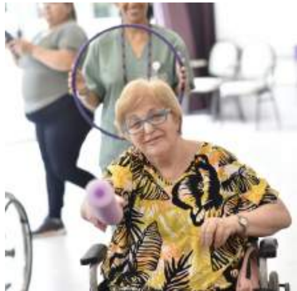
Día de la Actividad Física.