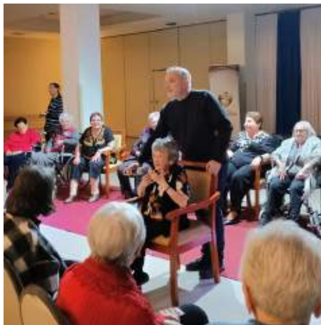
Presentación Sobre amores y otros recuerdos.